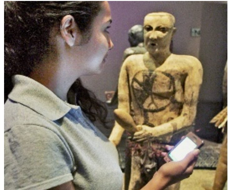
► Quienes visiten la exposición permanente del Museo del Palacio podrán descargar un audio guía en su celular o reproductor.