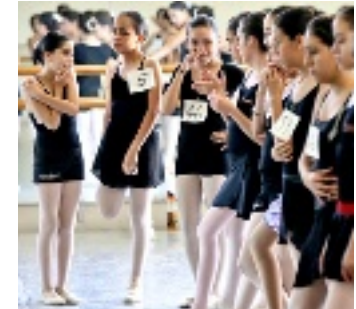
► Niñas de diversas academias han audicionado para “El Cascanueces”, del Ballet de Monterrey.

Cada aspirante deberá presentar autorización por escrito de la academia y sus papás para asis-