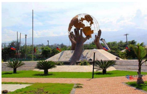
Monumento de las Tres Manos: Haití para al mundo (Puerto Príncipe)