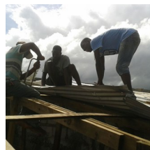
Las labores de reconstrucción en la isla