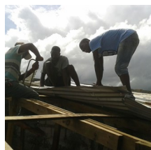
Las labores de reconstrucción en la isla