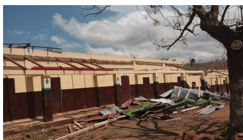
Nuestra Señora de la Nativité, Dame-Marie

Los Hermanos Maristas residentes en la isla han estado trabajando infatigablemente para servir y ayudar nuestras comunidades. En un primer momento, fue complicado evaluar los daños, debido a la dificultad de la comunicación con las comunidades de Jérémie, Latibolière, Dame-Marie y Les Cayes, cuyos habitantes comparten haberlo perdido todo. Después, se identificó que las tres escuelas Maristas en la isla habían sido damnificadas severamente, con techos caídos, ventanas rotas, paredes arruinadas, paneles solares destruidos y tinacos de agua rotos o desaparecidos. Además, muchas casas de las poblaciones afectadas, entre las cuales las de los mismos hermanos y sus familias, se encontraban con damnificaciones variadas, entre ligeras y muy severas. En los casos más graves, algunas casas fueron totalmente destruidas y otras todavía resultan inhabitables, por daños a los cimientos, paredes, techos y tinacos.