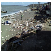
La situación hoy en día