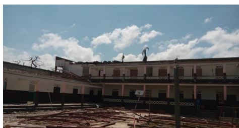
Nuestra Señora de Fátima, Dame-Marie