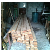
Estatus de la campaña Solidaridad para Haití