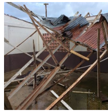
Las labores de reconstrucción en el país