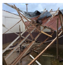
Las labores de reconstrucción en el país