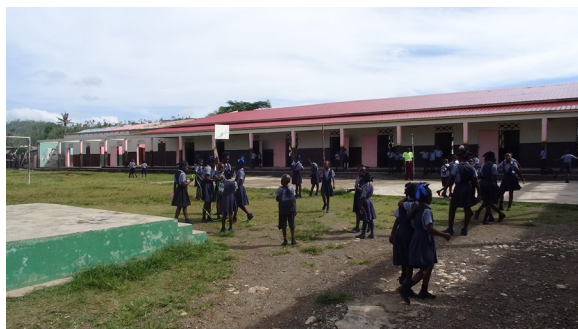
Regreso a clase en la Escuela de Fátima

Las escuelas en Latibolière y Dame-Marie lentamente han reanudado actividades. En la primera comunidad mencionada, se reiniciaron las labores educativas el día 14 de noviembre, sin embargo 30 alumnos no han vuelto (10 por mudarse a otra ciudad y 20 por problemas económicos o de salud). En Dame-Marie, el Colegio de la Nativité logró reanudar clases el día 7 de noviembre; sin embargo, todavía se necesitan reparaciones en algunas partes del edificio. Por su lado, la Escuela de Fátima empezó clases el día 28 de noviembre; no obstante, todavía falta arreglar el techo de tres salones (de ocho), por lo cual se decidió fusionar algunos grupos, de tal manera que se pudiese seguir con el año escolar.