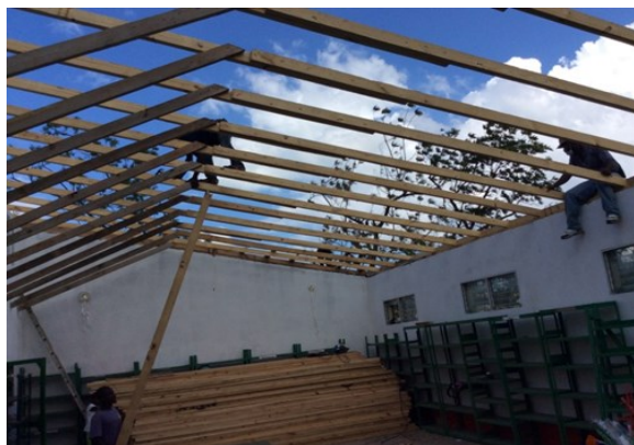
Reconstrucción del techo de la biblioteca de la Escuela de Nativité