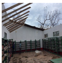
Estatus de la campaña Solidaridad para Haití