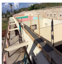
La situación hoy en día