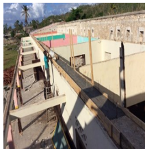
La situación hoy en día