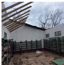
Estatus de la campaña Solidaridad para Haití