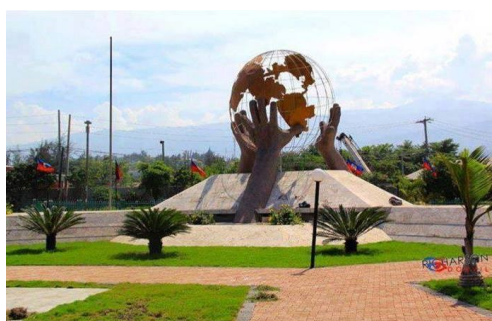
Monumento de las Tres Manos: Haití para al mundo (Puerto Príncipe)